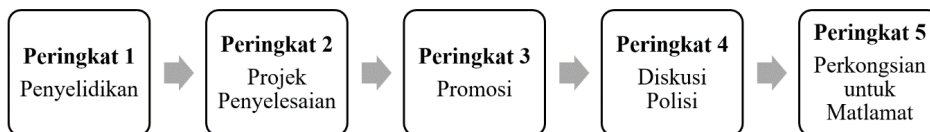
Gambar Rajah 2: Gerak Kerja APPGM-SDG